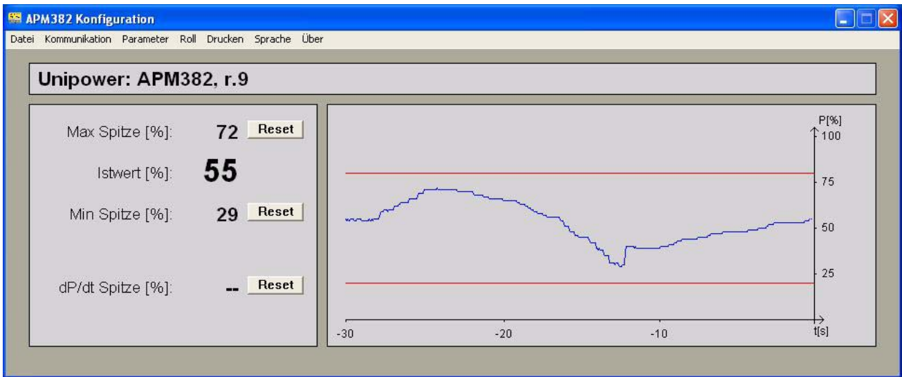
Abbildung 2.1 Bildschirmgestaltung

Neben der Einstellung aller Parameter des APM 382 dient die Software auch zur Darstellung der aktuellen Leistung als Zahlenwert und in Kurvenform mit einer Zeitdauer von 10, 30 und 60 Sekunden. Zudem erfolgt die Anzeige der erreichten Min. und Max. Spitzenwerten, sowie der dP/dt Spitzenwert soweit der Modus aktiviert ist. (Abb. 2.1)