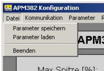
Abbildung 3.3 Das Datei-Menü

Die eingestellten Parameter des APM382 können zur Dokumentation oder Übertragung auf weitere Module als Datei abgespeichert werden. Diese Funktion ist im Menü "Datei" erreichbar (Abb. 3.3)