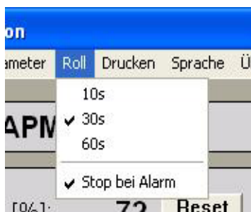
Abbildung 2.3 Roll-Einstellungen

Das Rollfenster stellt den zeitlichen Verlauf der Messung sowie die aktiven Grenzen dar. Der dargestellte Zeitbereich kann auf 10, 30 oder 60 Sek. eingestellt werden.