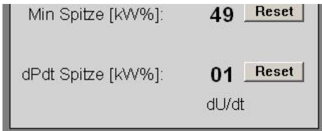
Abbildung 2.2 Anzeige Spannungsspitze dU/dt.

Die Spitzenspeicher können über die zugehörigen "Reset"-Taste auf den aktuellen Wert zurückgesetzt werden. Alle 10 ms wird ein neuer Messwert übertragen. Die Aktualisierung der Anzeige erfolgt alle 300 ms. Tritt eine Spannungsspitze (dU/dt) auf, wird dies sofort unter dem dP/dt-Spitzenwert in der Form von "dU/dt" dargestellt (Abb. 2.2).