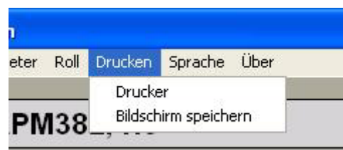
Abbildung 2.4 Drucken

Die Software enthält die Möglichkeit auf Papier auszudrucken sowie in Windows bitmap (BMP) Format zu speichern.