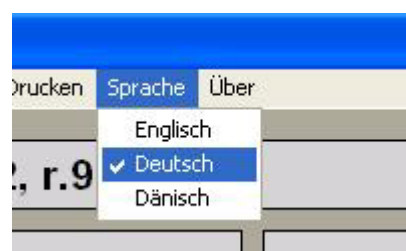
Abbildung 2.5 Sprache

382Mon unterstützt vor Moment drei Sprachen: Englisch, Deutsch und Dänisch - siehe Abb. 2.5.